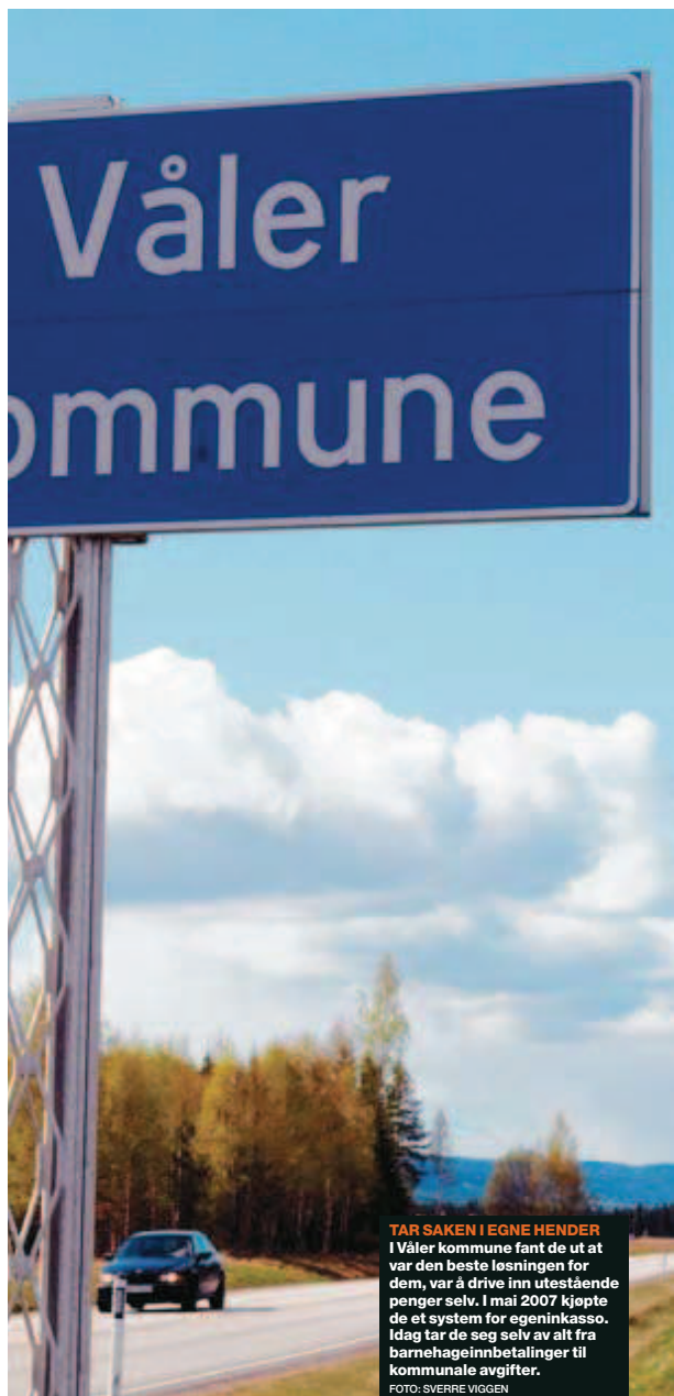
TAR SAKEN I EGNE HENDER I Våler kommune fant de ut at var den beste løsningen for dem, var å drive inn utestående penger selv. I mai 2007 kjøpte de et system for egeninkasso. Idag tar de seg selv av alt fra barnehageinnbetalinger til kommunale avgifter.